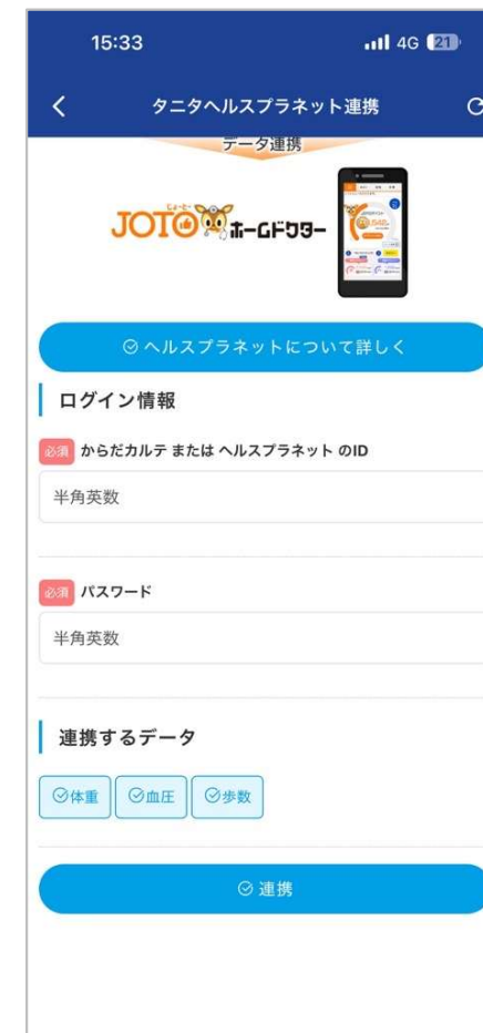
下にスクロールする