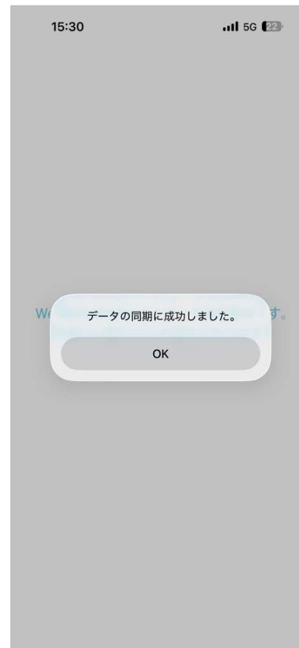
自動で同期される