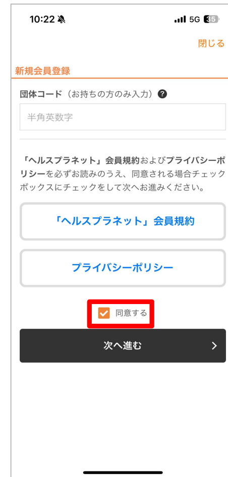
「同意する」をタップ