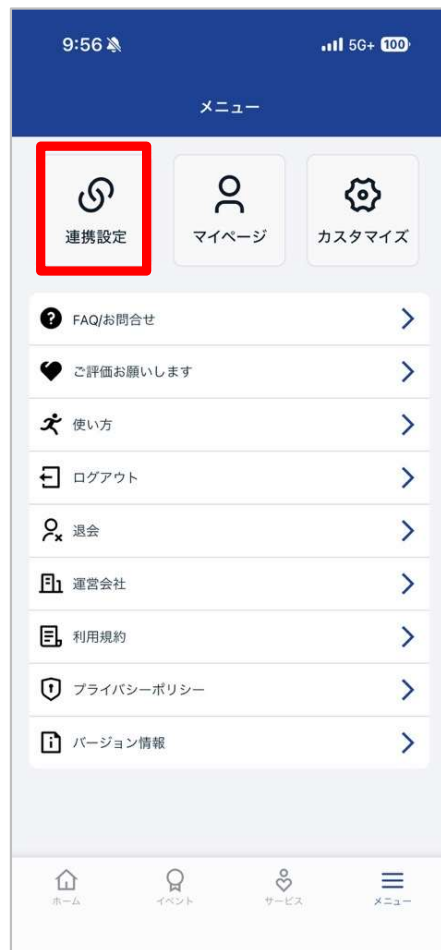
「連携設定」をタップ