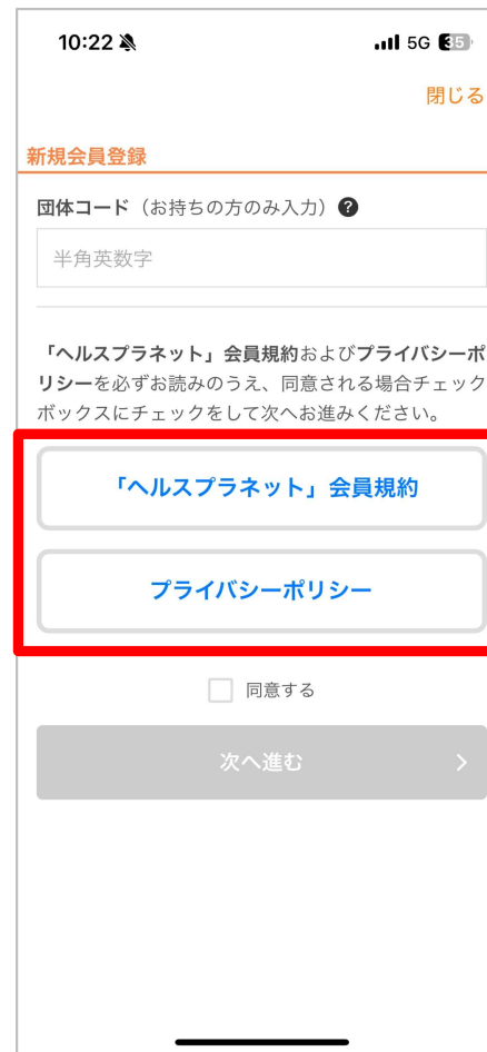
規約とポリシーを確認する