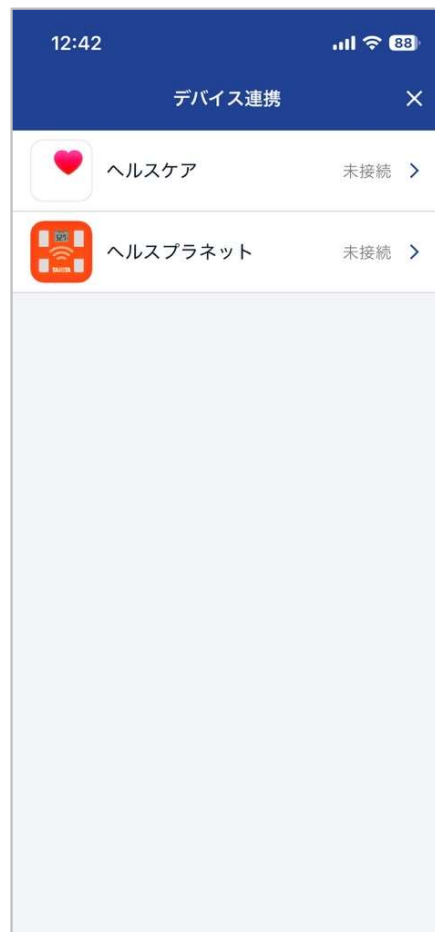
JOTOホームドクターに戻り 「ヘルスプラネット」をタップ