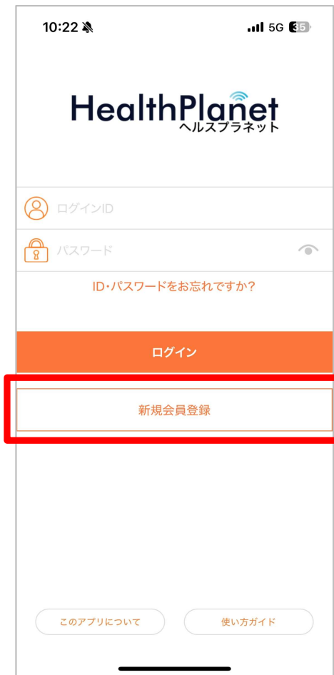
「新規会員登録」 をタップ