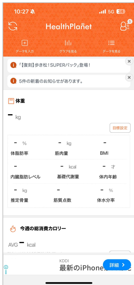
ヘルスプラネットの ホーム画面が開く