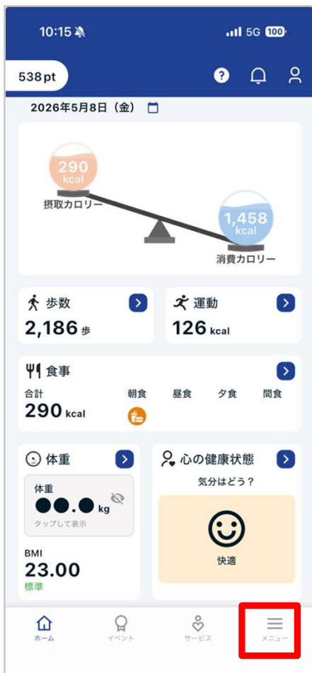
「メニュー」をタップ