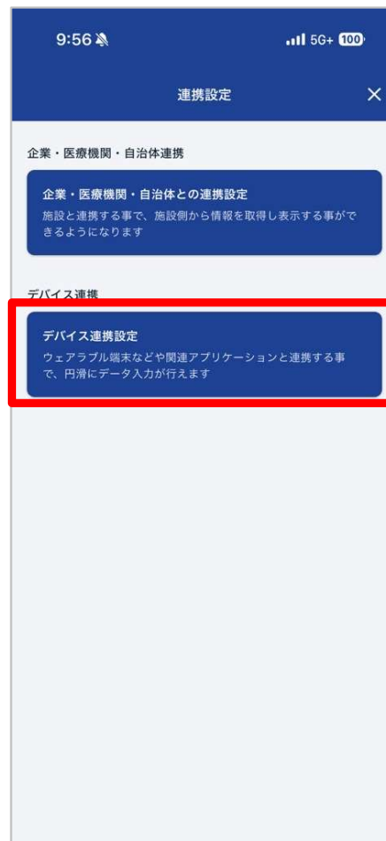
「デバイス連携設定」をタップ