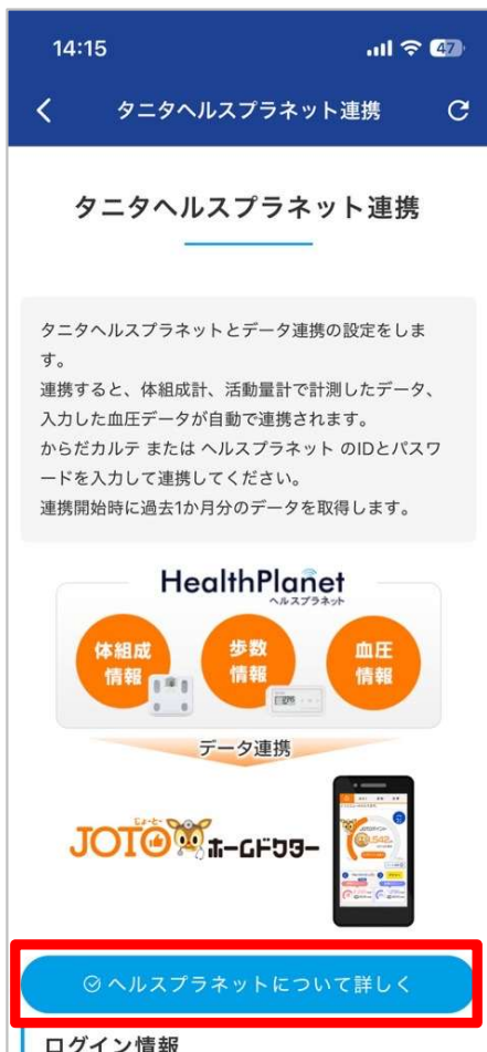
「ヘルスプラネットについて詳しく」 をタップ