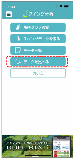
① アプリメニューから「データを比べる」をタップ

計測した2つのスイングデータを比較することで、ご自身の癖や特徴などを掴むことが可能です。