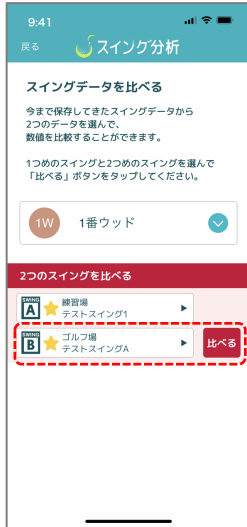
④ 同じようにBスイングの選択を進め、「比べる」ボタンをタップ