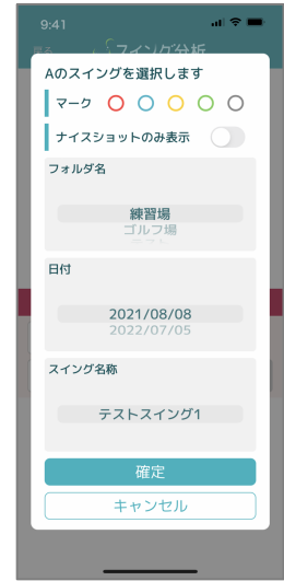
③ スイング選択はフォルダや日付、マーク等で探します