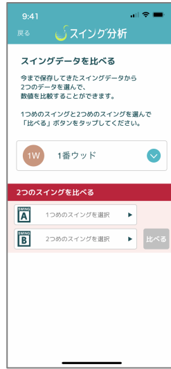
② AとBのスイングを選択します クラブ別で変更可能です