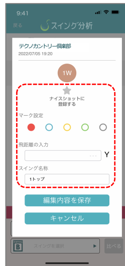
⑥ ナイスショットや飛距離、メモやマークをつけることが可能です ※3

※1 スイング一覧から右上の「削除」ボタンで不要なスイングを消去することも可能です。