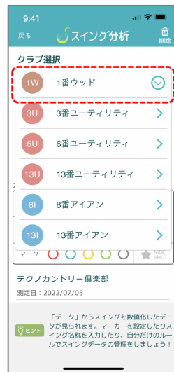
③ クラブ別の場合、目的のクラブを選択します