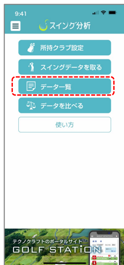
① アプリメニューから「データ一覧」をタップ

計測したスイング一覧から目的のスイングを閲覧したり、ナイスショットの目印をつけるなど編集が可能です。