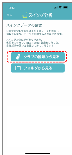
② クラブ別/フォルダ別でスイング検索ができます