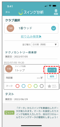
④ クラブ絞り込み一覧が現れます「データ」でスイング詳細へ ※1