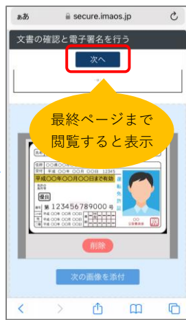
⑦ 添付が終わりましたら、「次へ」をタップします。