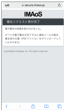
⑨ 以上で電子署名の操作が完了です。すべて署名が完了すると通知が届きます。