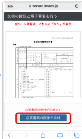
④ 契約書を最後まで閲覧し、「必要書類の画像を添付」をタップします。