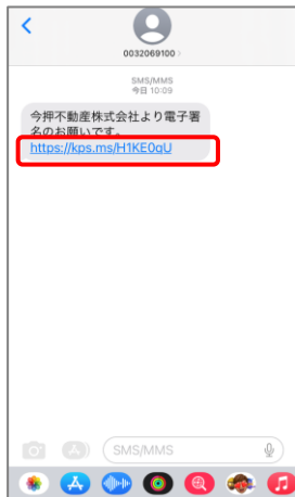
② ショートメールのリンクをタップします。