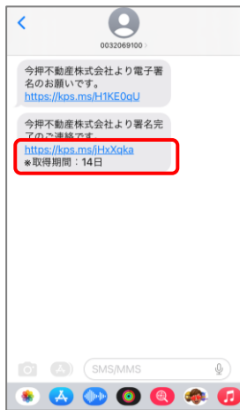
⑩ 通知メールが届きましたら、14日以内に契約書をダウンロードしてください。