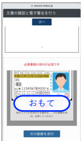
⑤ カメラ機能で身分証(※)を撮影します。