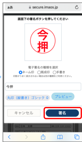
⑧ 印影が表示されますので「署名」をタップします。