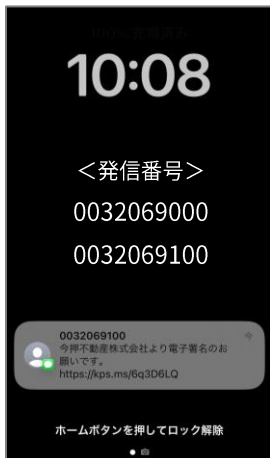
① 電子署名依頼のショートメールが届きます。

■ iPhone / iPad Safari Chrome ■ Android Chrome